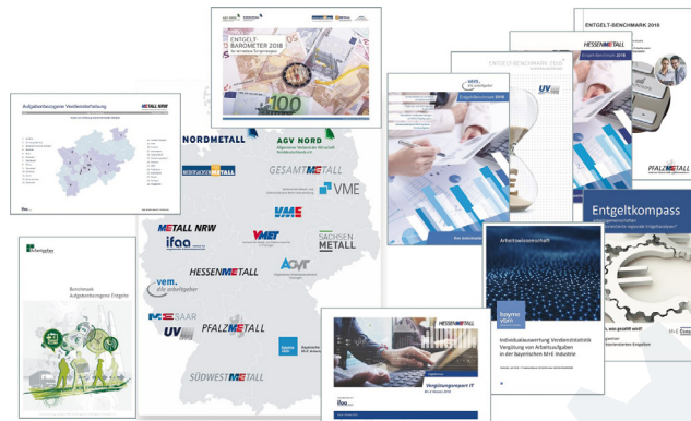
Beispiele individueller Broschüren