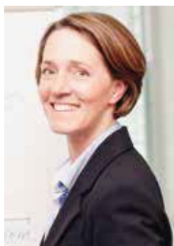
Claudia Hupe Hengst SE & Co. KG

Neben der Arbeitsbewertung mit den tariflichen Verfahren im Rahmen des Entgeltrahmenabkommens (ERA) in der Metall- und Elektroindustrie kommt der systematischen Bewertung der Arbeitsaufgaben von Leitenden Angestellten und jener im AT-Bereich eine immer stärker werdende Bedeutung zu. Zum einen werden von den Arbeitnehmervertretungen zunehmend entsprechende Systeme gefordert, zum anderen muss den im Rahmen der Entgeltgleichheit geplanten Regelungen im Entgeltgleichheitsgesetz, welches 2017 in Kraft treten soll, Rechnung getragen werden.