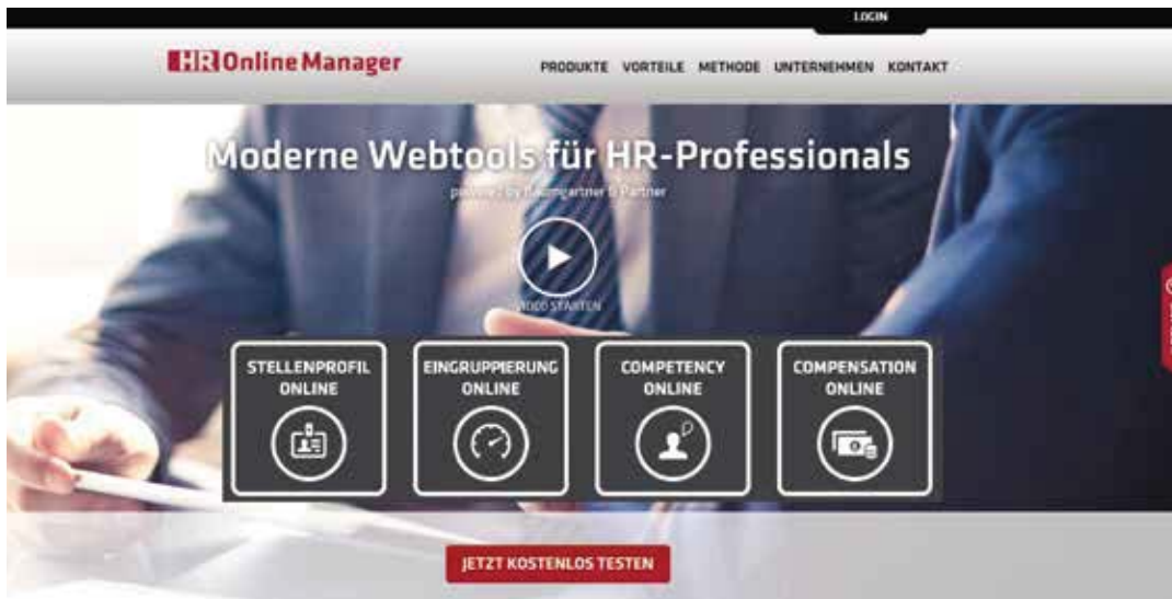
Abb. 1: HR Online Manager, Übersicht der Web-Instrumente