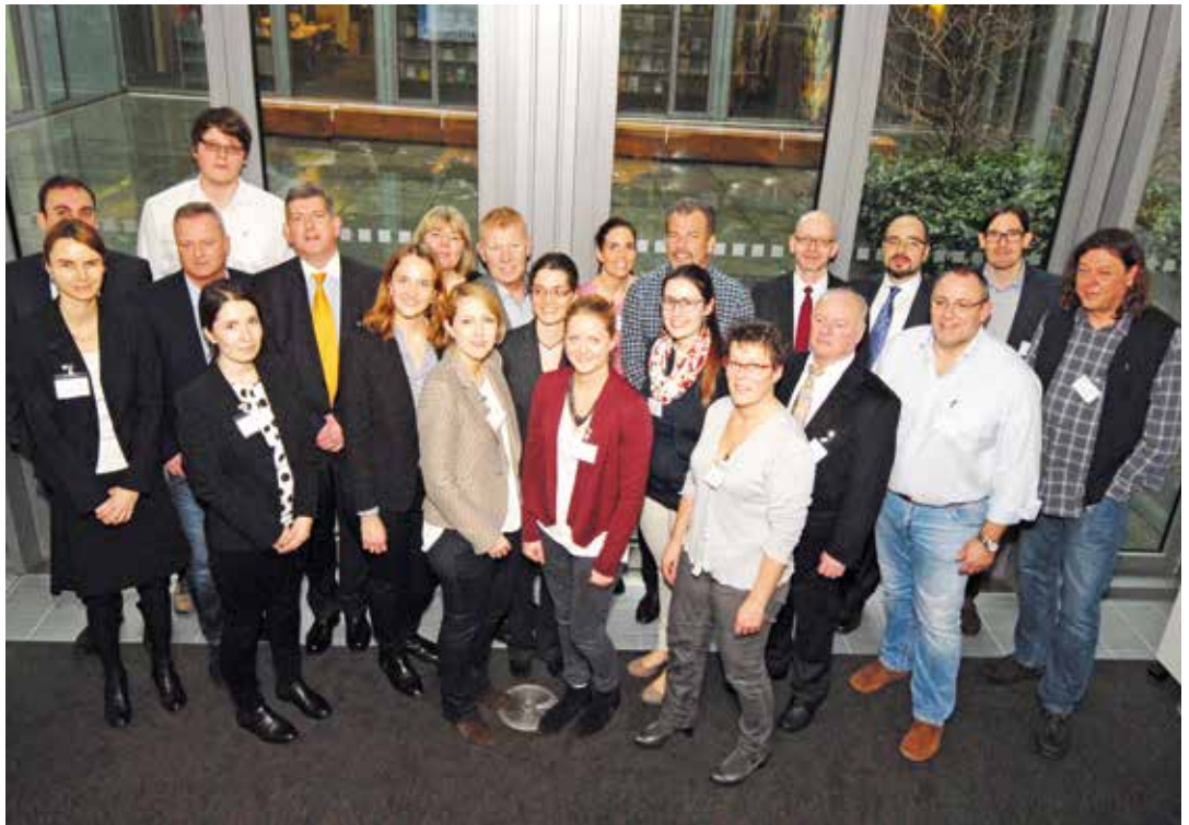
Abb. 2: Projektpartner bei der Auftaktveranstaltung