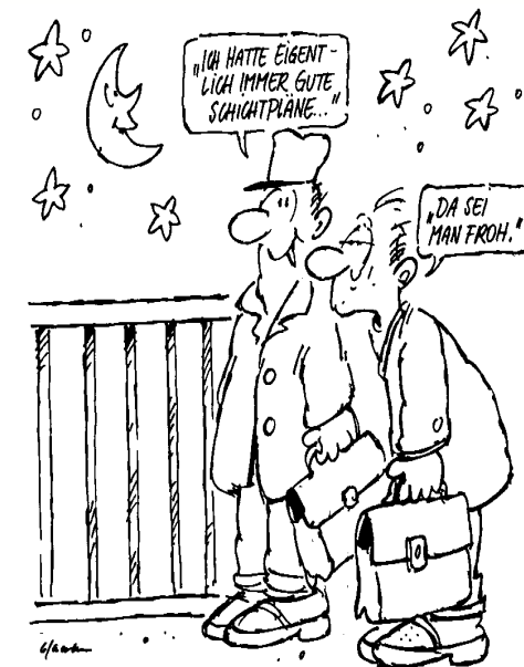
(Beermann 2005, modifiziert)