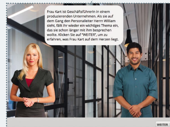
Lösungsansätze zur Bewältigung von Herausforderungen mit Vielfaltsbezug