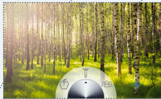
Maßnahmen für ein vielfaltsbewusstes Gesundheitsmanagement

Der Herausforderung Fachkräftesicherung begegnen! Mit Vielfaltsbewusstsein Fachkräfte gewinnen.